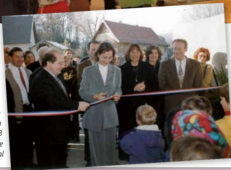
La réouverture de l'école en novembre 1998 avec la Ministre Ségolène Royal