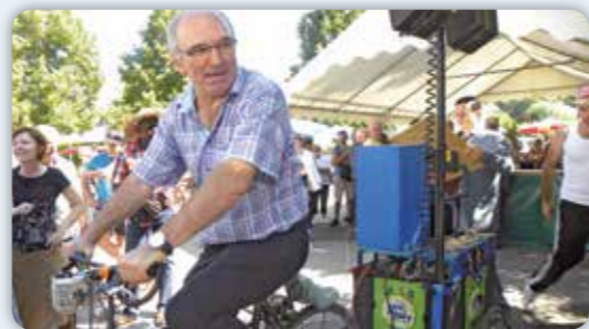
Foire Agricole de Pinet 2018

L'agriculture est, sans aucun doute, parmi les activités humaines, l'une de celles qui restent le plus directement influencées par le climat. Elle contribue au changement climatique et en subit les effets, mais elle fait aussi partie de la solution.