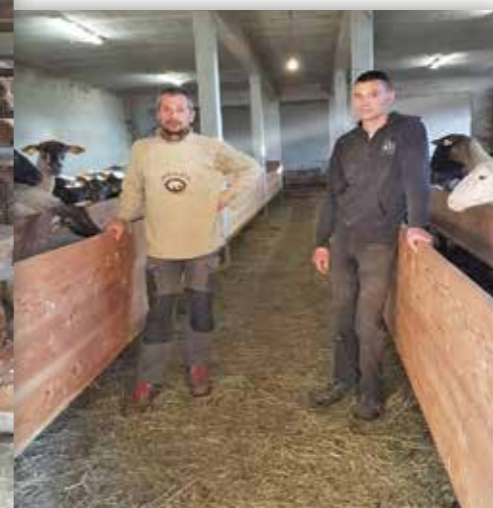
GAEC de la Grivolée