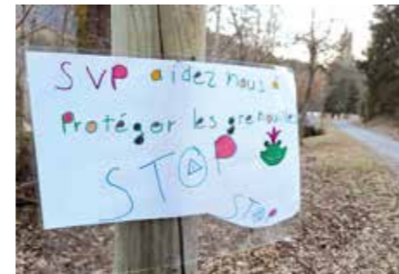
* Club CPN : Club Connaître et Protéger la Nature.

Le 27 mars dernier la Ligue de Protection des Oiseaux (LPO) et les Clubs CPN* « Renardeaux de Pinet » et « Martins-Pêcheurs » se sont retrouvés à l'Espace Naturel Sensible du Marais des Seiglières pour mettre en place une zone de protection des amphibiens. Cette action a été menée avec l'accord de l'Union des pêcheurs et le soutien logistique de la commune.