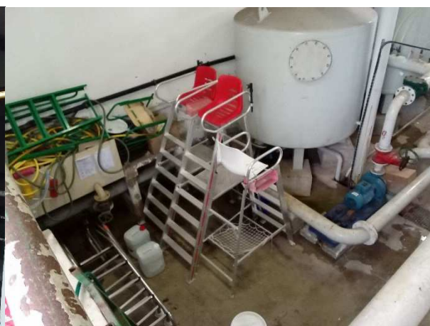
Poste de secours et bureau MNS