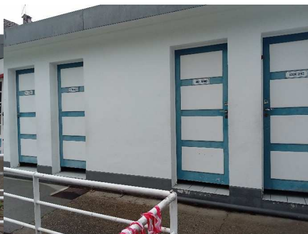
Douches et sanitaires