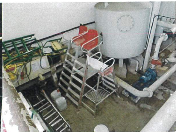
Poste de secours et bureau MNS