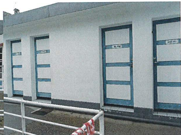
Douches et sanitaires